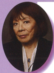
秋吉敏子 Toshiko Akiyoshi

この地球(ほし)に生きるすべての子どもたちのために 世界のミュージシャンが集結!