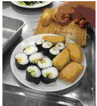
上手にお寿司ができました