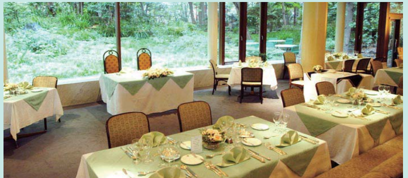
レストラン シェ・モルチェ