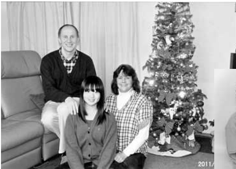
養子縁組をした家族から 寄せられたクリスマスカード

今年も多くの皆様のお力を頂いて、役職員一同心を合わせて活動してまいります。活動資金が不足しております。皆様からのご支援、ご寄附（寄付控除の対象となります）、またチャリティ映画会やコンサートへのご協力を賜りますようお願い申し上げます。